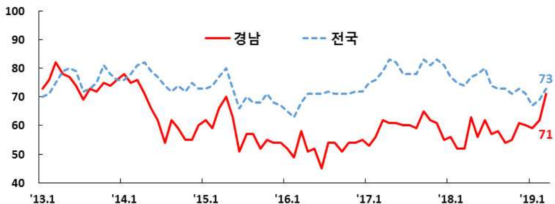
경남·전국 제조업 업황BSI 1)

주 : 1) 「호조」 응답업체 구성비(%) - 「부진」 응답업체 구성비(%) + 100